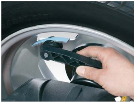
Braccio di misura

Ciclo di equilibratura (start/stop) estremamente breve di 4,5 secondi.