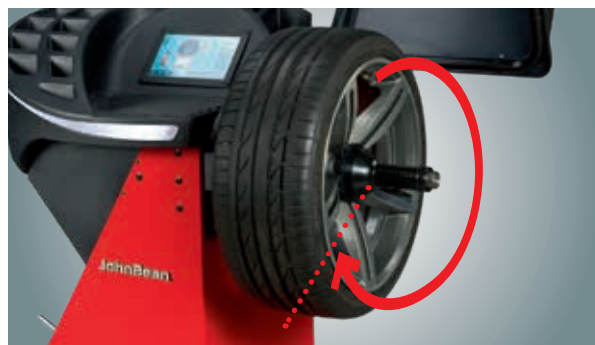
Arresto in posizione

Due operatori possono lavorare contemporaneamente sull'equilibratrice e richiamare rapidamente le dimensioni dei cerchioni.