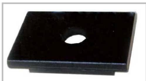
Piastra cacciaspine Press plate Abdrückplatte Plaque d'extraction Placa extractora de pasadores