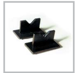
Prismi V-blocks Prismensatz Prismes à 'V' Prismas